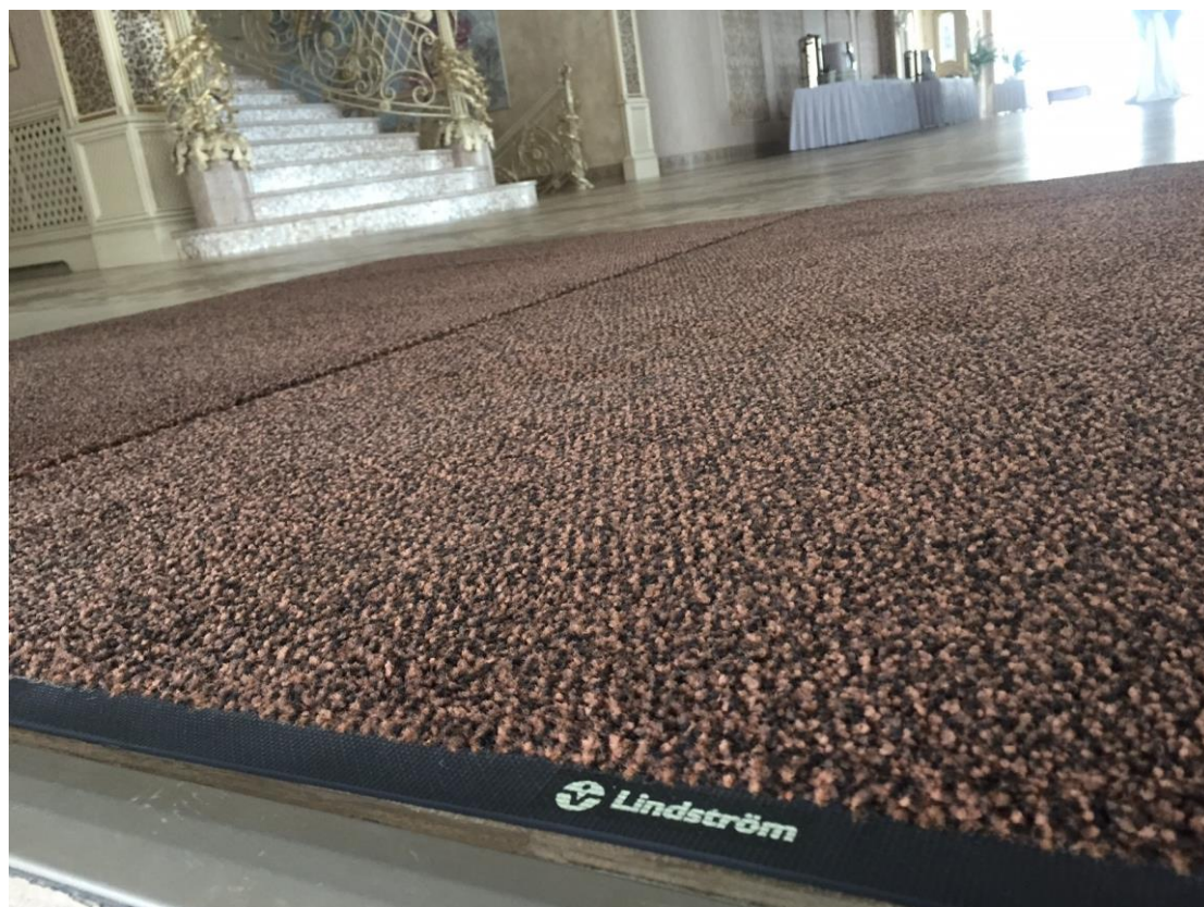
Фото - сравнение с коврами других контрагентов